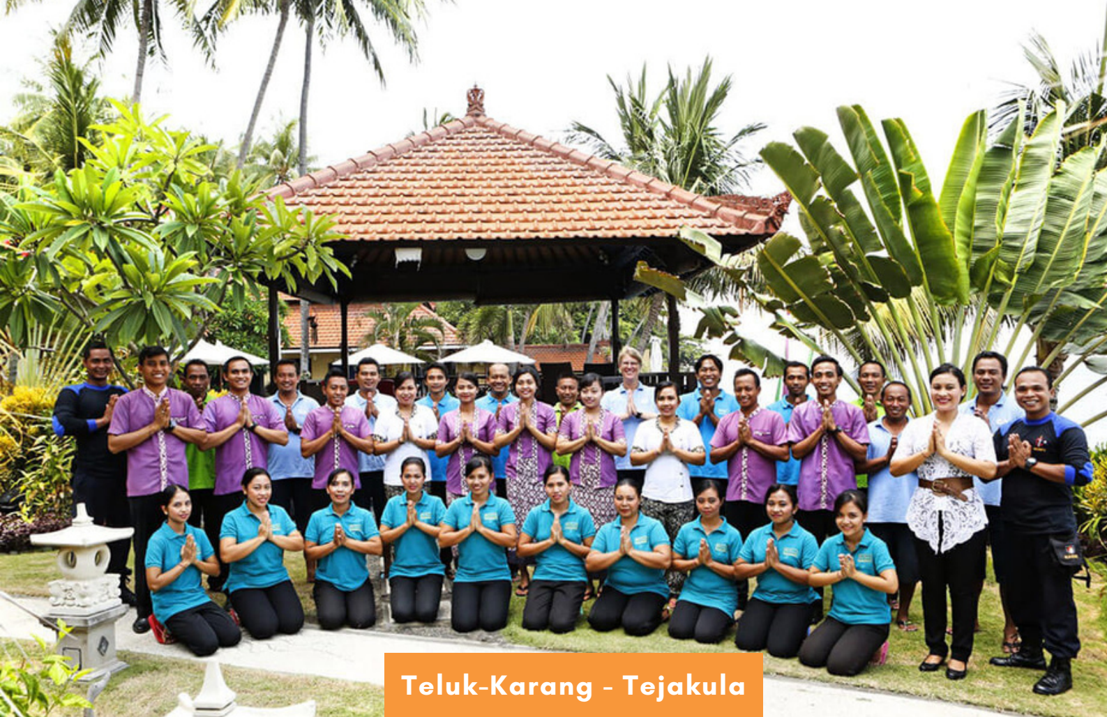
Teluk-Karang - Tejakula