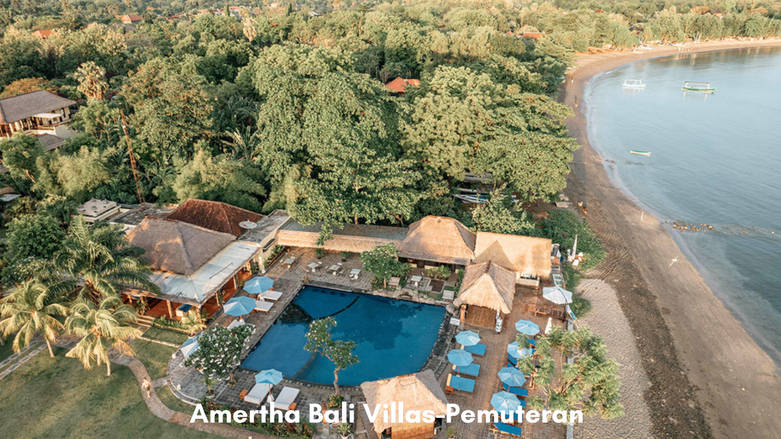
Amertha Bali Villas-Pemuteran