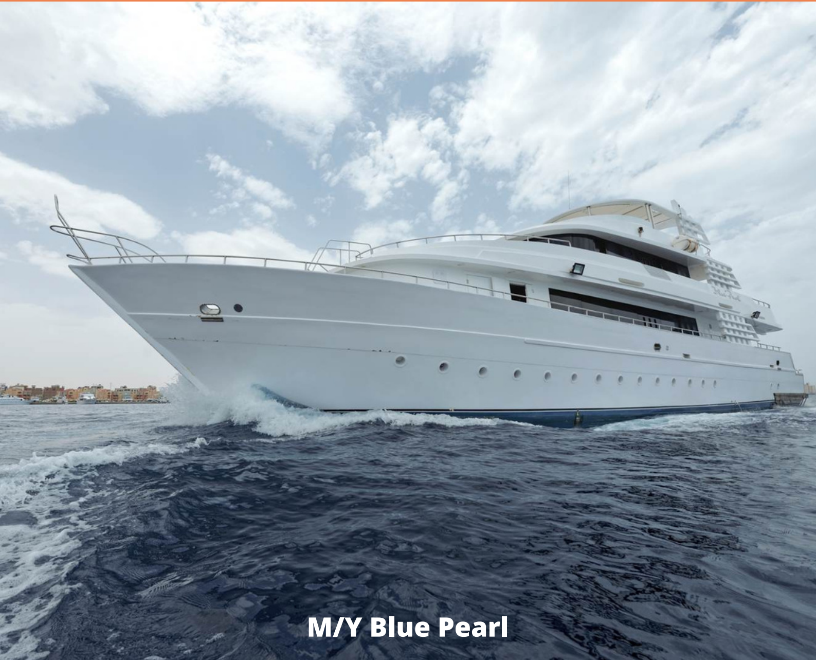
M/Y Blue Pearl