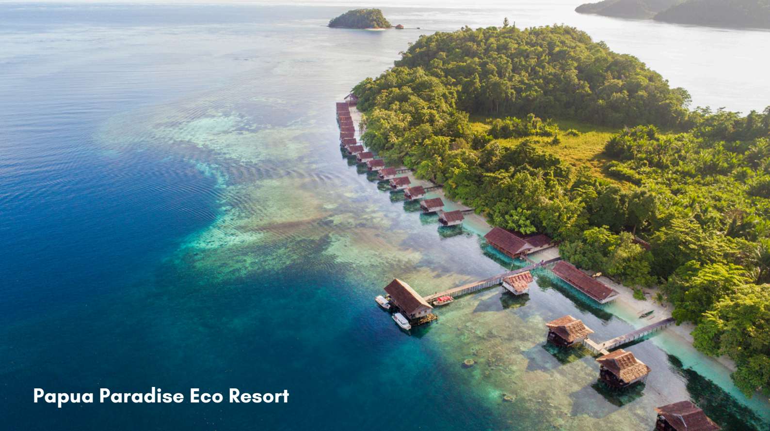
Papua Paradise Eco Resort