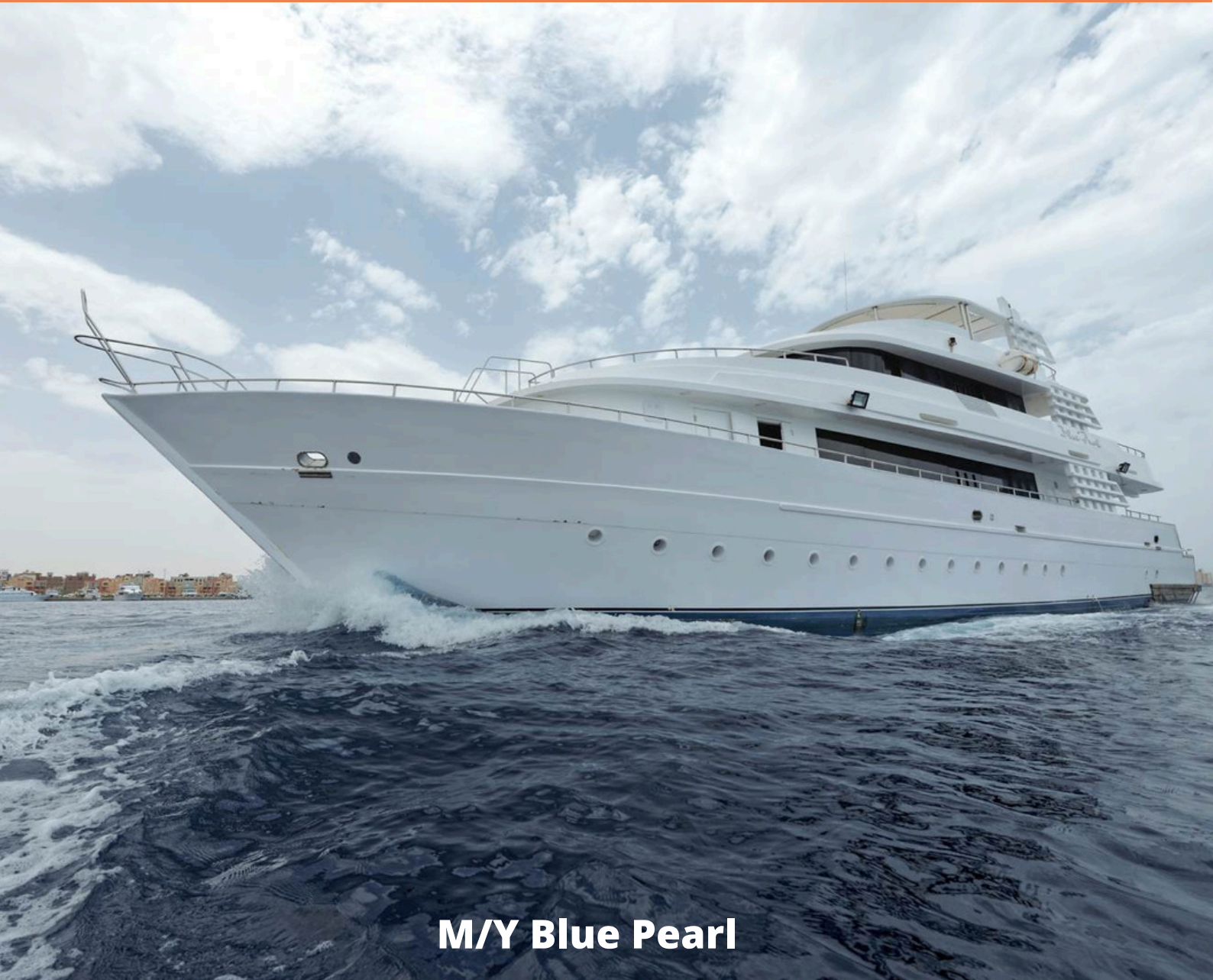
M/Y Blue Pearl