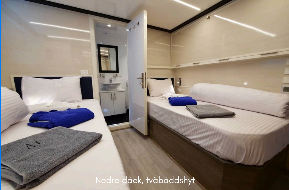
Nedre däck, tvåbäddshytt